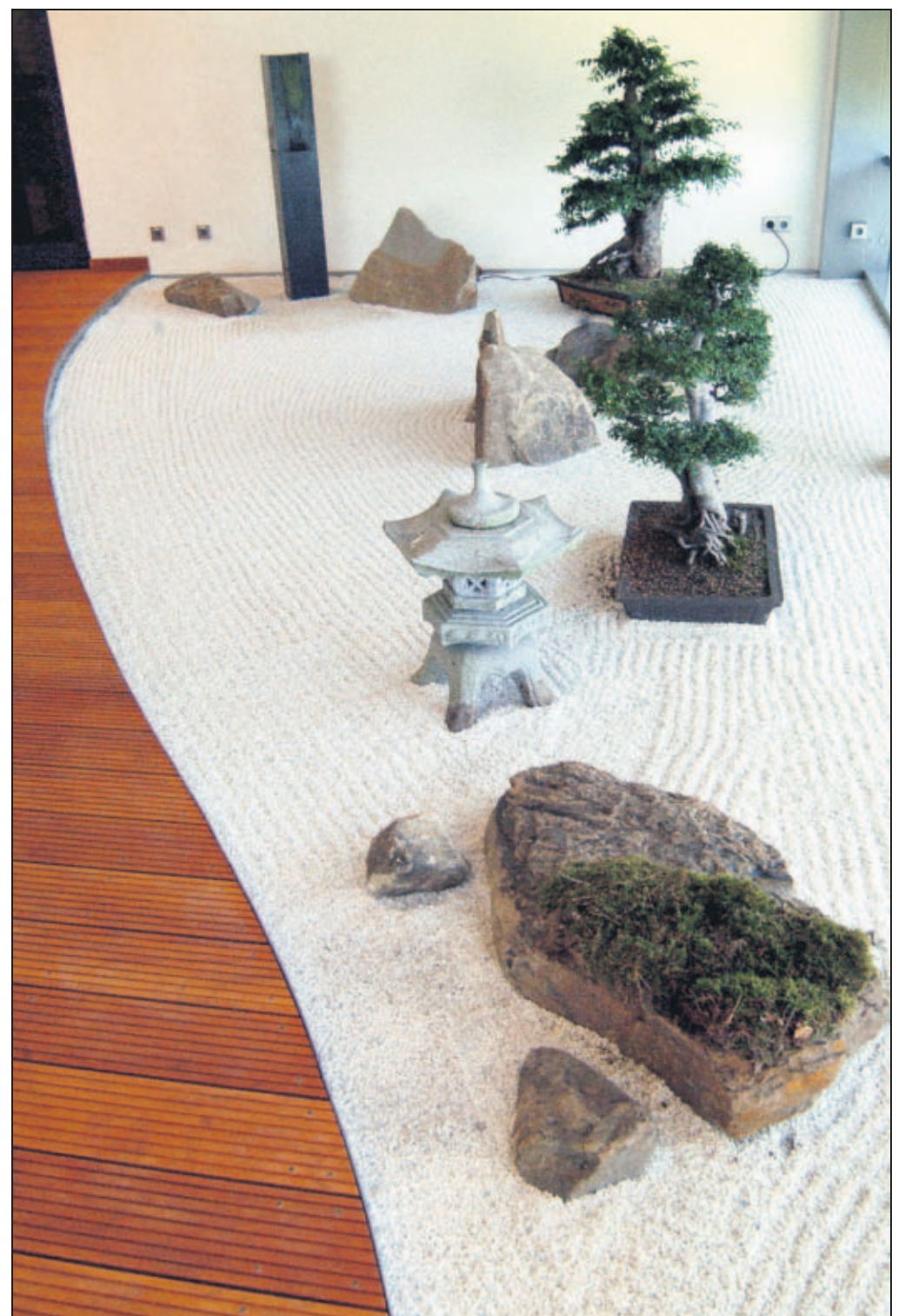
„Kanso“ - diese Einfachheit und Geradlinigkeit ist Gestaltungsmerkmal eines Zengartens, der unter anderem in japanischen Klöstern fester Lebens- und Glaubensbestandteil ist.

Dazu gehört übrigens auch, dass sich die „Hagakure“-Gäste für die Zeit ihres Aufenthaltes von ihren Zigaretten verabschieden müssen. Weil die nämlich auch nur ablenken und - wenn überhaupt - auf dem Freiluft-Balkon verkohlt werden dürfen. Dass die Hotelküche den Hagakure-Gäste nicht mit Jägerschnitzel daherkommt, versteht sich. Für Stäbchen-Esser gibt es die entsprechenden Angebote. Fiebig: „Wenn wir so ein in Deutschland einmaliges Angebot machen, muss natürlich alles drumherum stimmen.“