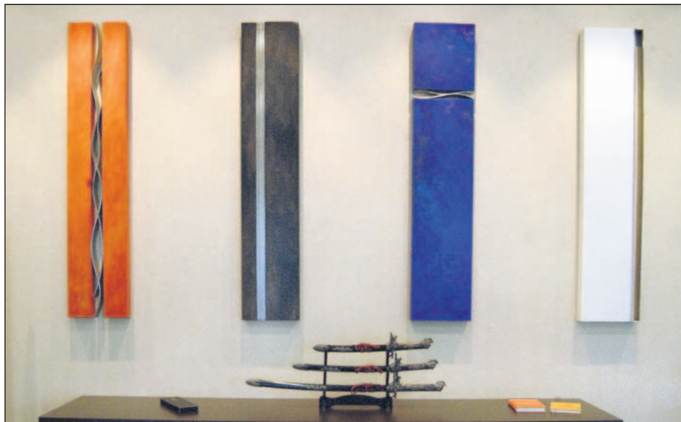
Die traditionellen Schwerter der Samurai und die fünf Grund-Elemente nach der buddhistischen Lehre - auch die gewählte Wandkunst soll helfen, die guten Gedanken und Strömungen durch den Raum zu schicken.