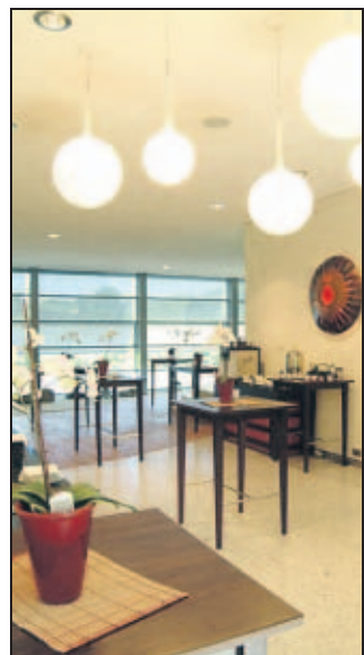
Das Foyer zum neuen Seminar-Bereich: Hier beginnt die Reise in die Welt der Ruhe.

Wir sind im Hotel „VierJahreszeiten“ am Seilersee. In der